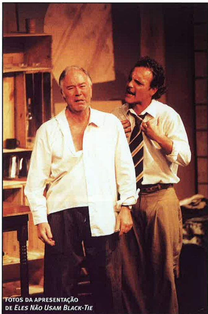
FOTOS DA APRESENTAÇÃO DE ELES NÃO USAM BLACK-TIE